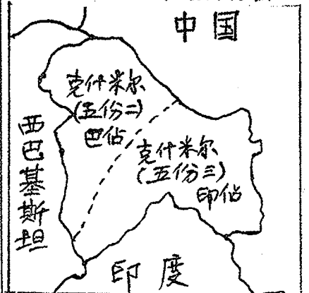
上圖之斜綫區域為印巴爭執地區——克什米爾

解決印巴糾紛的唯一途徑是，印巴雙方撤退在爭執區所有軍隊以及印巴雙方同意在克什米爾舉行全民投票，由該地人民選擇要併入印度或巴基斯坦，也就是充份的允許該地人民有主理本地事務的自決權，自決權是全世界愛好和平的家國，都承認由該地人民去決定他們的前途，是唯一解決印巴兩國為克什米爾之爭最好方法。